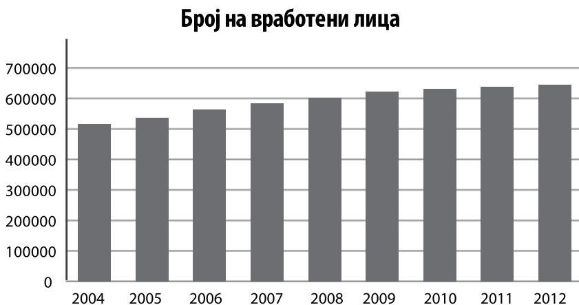
Слика 1 Број на вработени лица (2004 – 2012)

Според податоците на Државниот завод за статистика во периодот од 2008 до 2012 година стапката на вработеност расте, но со побавно темпо споредено со периодот 2003 – 2008 година. Бројот на нови креирани работни места во периодот од 2008 до 2012 година е околу 41.608 (8.322 нови работни места годишно во просек), наспроти 85.615 нови креирани работни места во периодот од 2004 до 2008 година (21.404 нови работни места годишно во просек). (Слика 1)