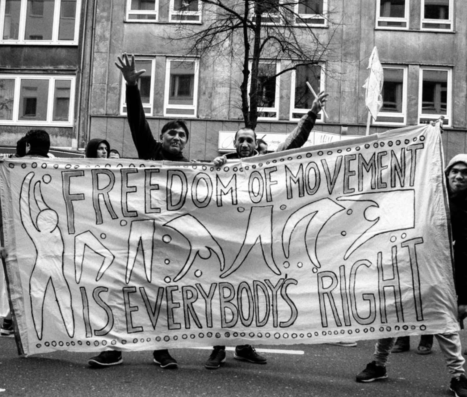
Otporoma - Roma Revolution demonstracije u Dizeldorfu, 9. novembar 2015.