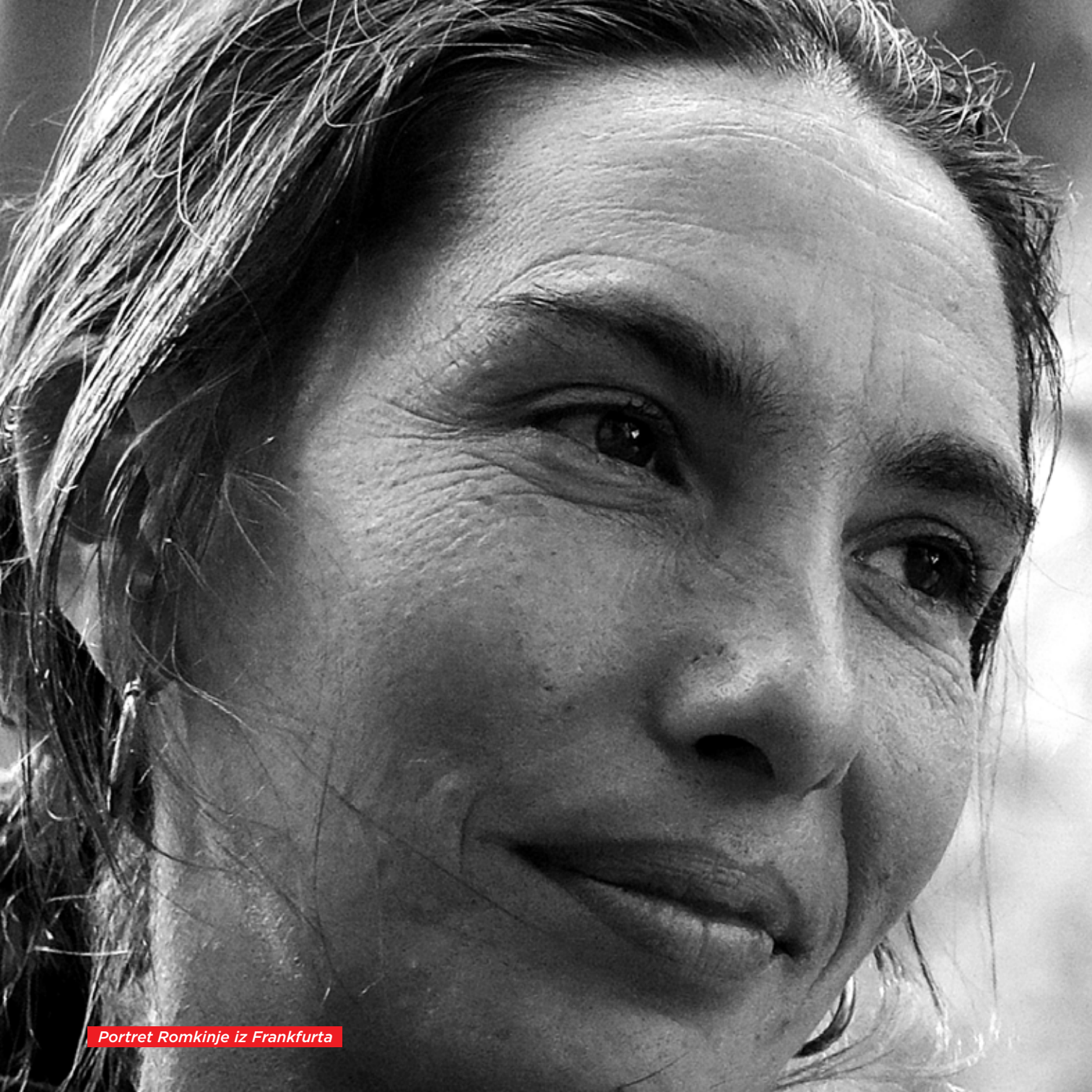
Portret Romkinje iz Frankfurta