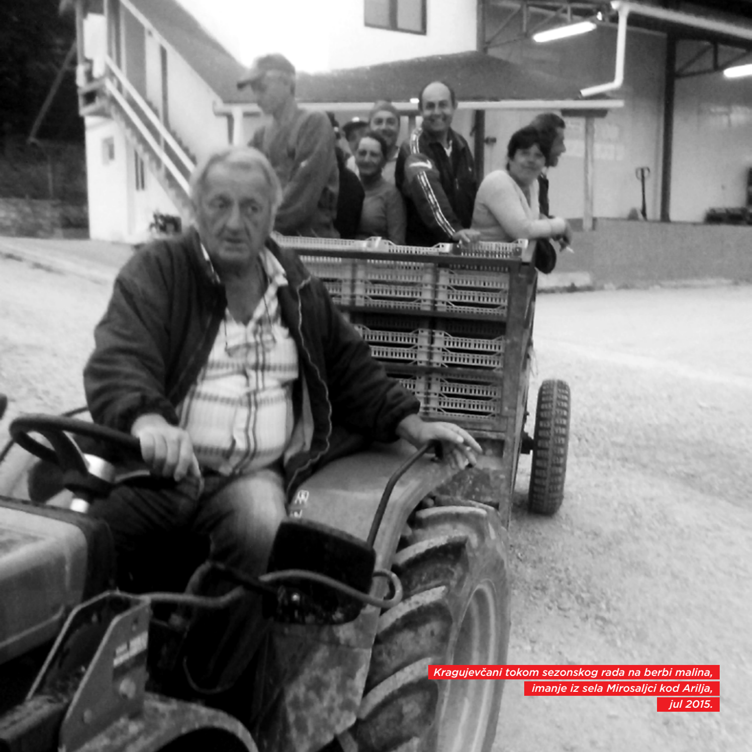
Kragujevčani tokom sezonskog rada na berbi malina, imanje iz sela Mirosljci kod Arilja, jul 2015.