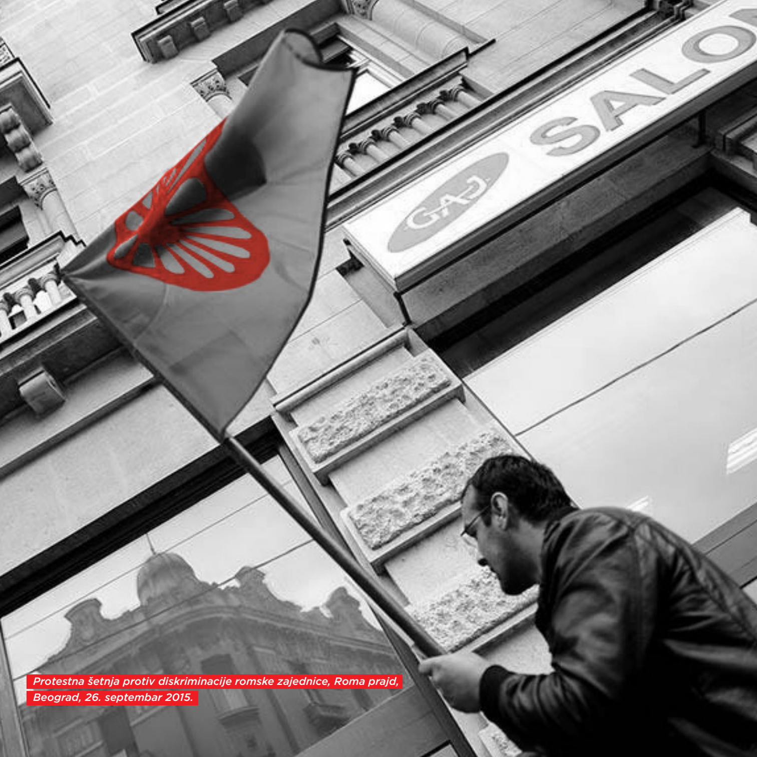
Protestna šetnja protiv diskriminacije romske zajednice, Roma prajd, Beograd, 26. septembar 2015.