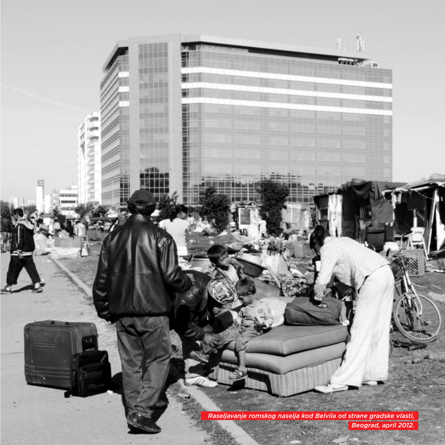
Raseljavanje romskog naselja kod Belvila od strane gradske vlasti, Beograd, april 2012.