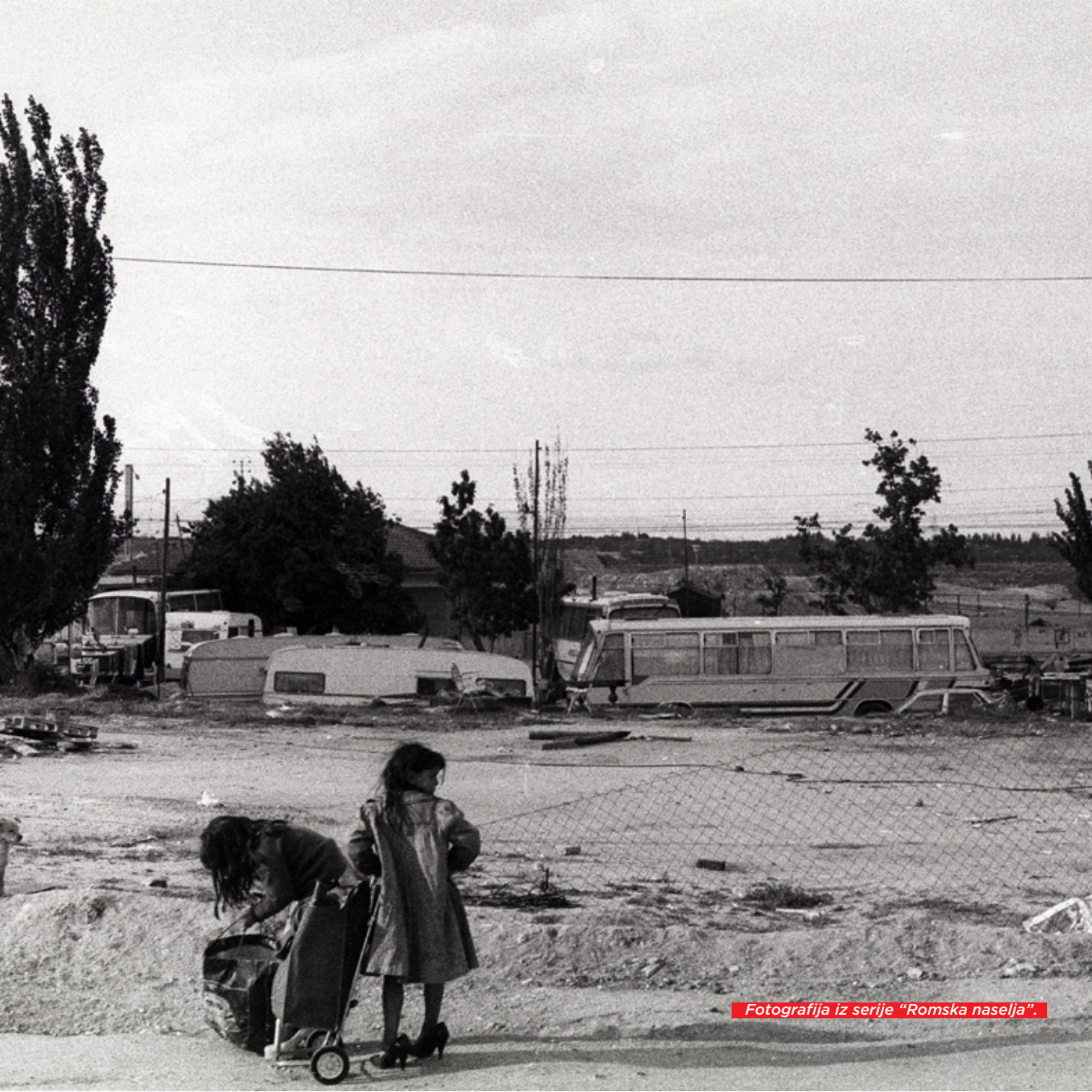
Fotografija iz serije "Romska naselja".