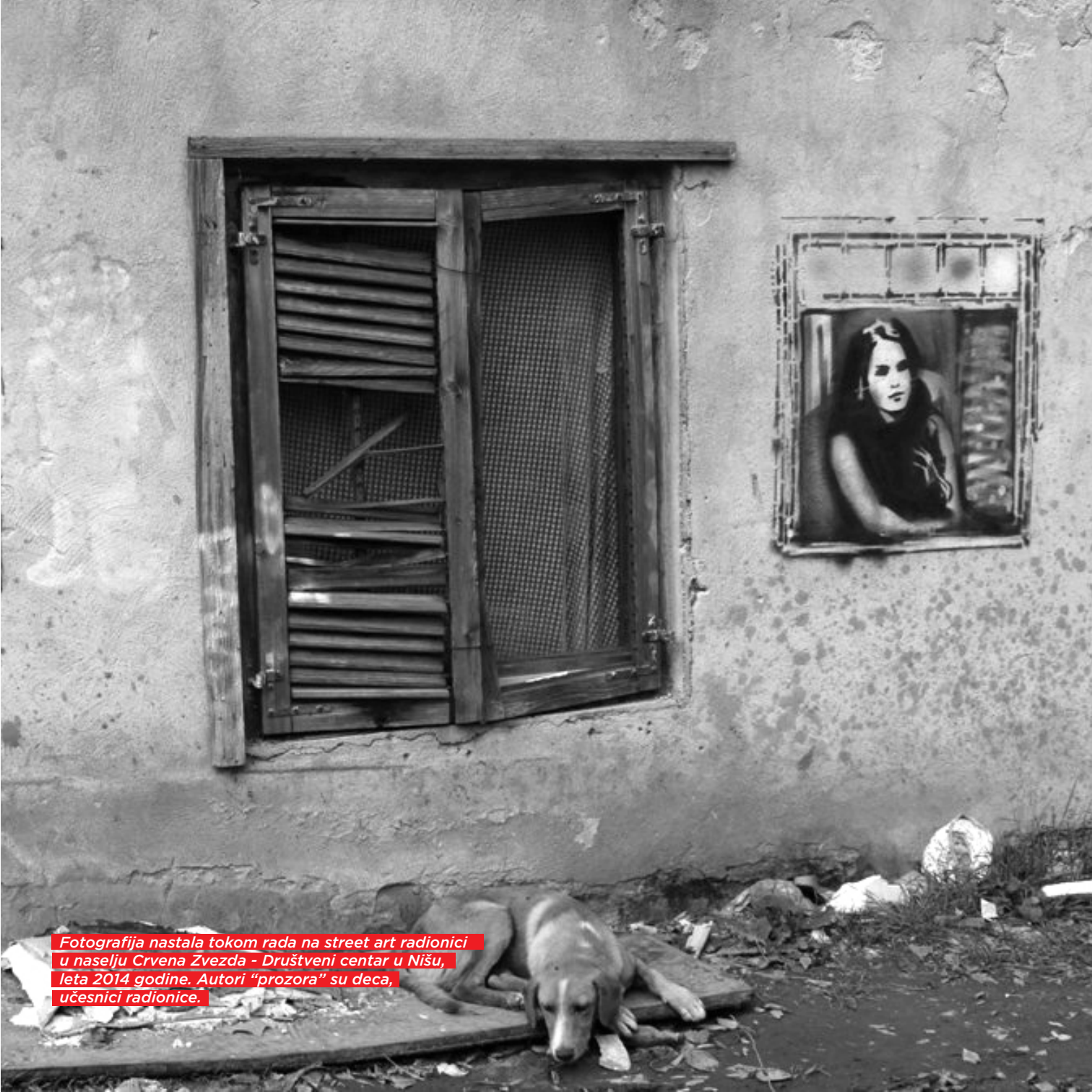
Fotografija nastala tokom rada na street art radionici u naselju Crvena Zvezda - Društveni centar u Nišu, leta 2014 godine. Autori "prozora" su deca, učesnici radionice.